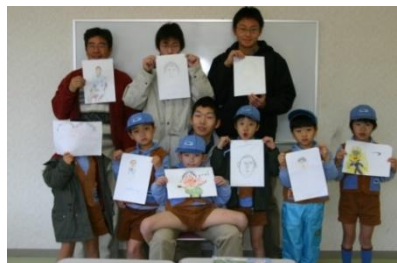
2004.1 多くの三重大生に助けていただきました。