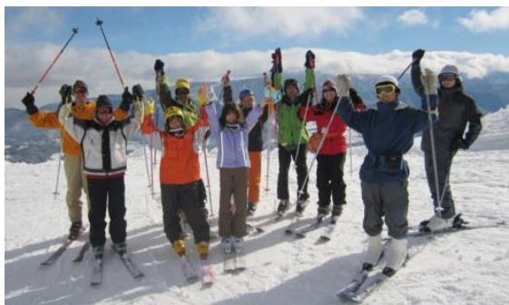
2010.1 団スキー また行きたい。。