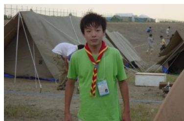
2002.8 第13回日本ジャンボリー

私はビーバーからスカウト活動をしています。同じジャンボリーでも少し異なった参加の仕方があるようにビーバー、カブ、ボーイ、ベンチャー、ローバーと上進していく過程でやることやできることが徐々に変化していくこともスカウト活動の楽しみだと思います。