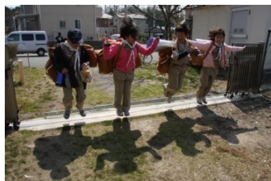
2009.3 キャンプから帰着!!