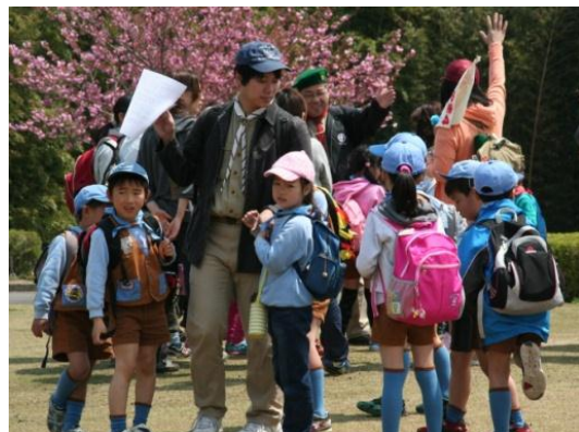
4/24 ビーバーカブラリー

♪あんど山でのごうどうたいしゅうかい、つうじょうしゅうかいは、9時から11時まで、もちものは、ビーバー用具、すいとう♪