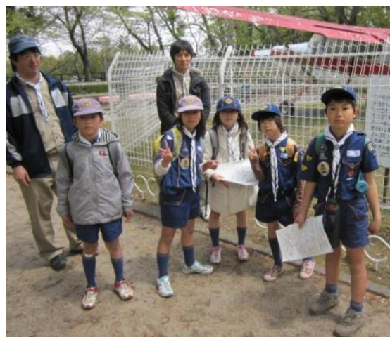
4/24 ビーバーカブラリー