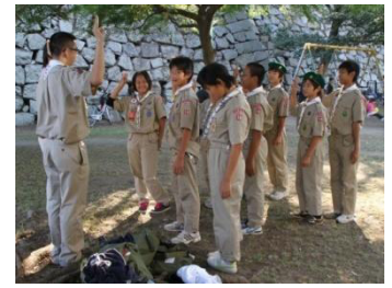
津まつり奉仕活動

新しい班ができ仲間も増えました。 スカウト同士スキルを磨き、今後の活動も意欲的に頑張ろう！