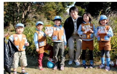
12/11 土山隊長お別れ会

♪あんどら山でのごうどうたいしゅうかい、つうじょうしゅうかいは、9時から11時まで、もちものは、ビーバー用具、すいとう♪