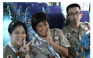
8/4-9 東海三県合同野営大会