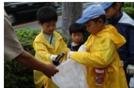
9月8日 カントリー大作戦