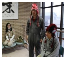
10月20日 ボーイ隊サポート