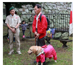
津まつり補助犬育成募金