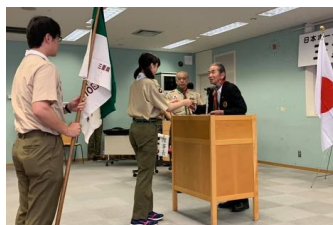
三重連盟2019年度年次総会に於いて、津10団ベンチャー隊が50年綬をいただきました。

いよいよ7月です。旧暦7月を文月（ふづき、ふみづき）と呼び、現在では新暦7月の別名としても用います。文月の由来は、7月7日の七夕に詩歌を献じたり、書物を夜風に曝す風習があるからというのが定説となっていますが、七夕の行事は奈良時代に中国から伝わったもので、元々日本にはないものです。そこで、稲の穂が含む月であることから「含み月」「穂含み月」の意であるとする説もあります。